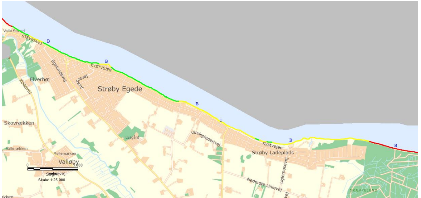
Zoneinddeling for Strøby Egede og Strøby Ladeplads.