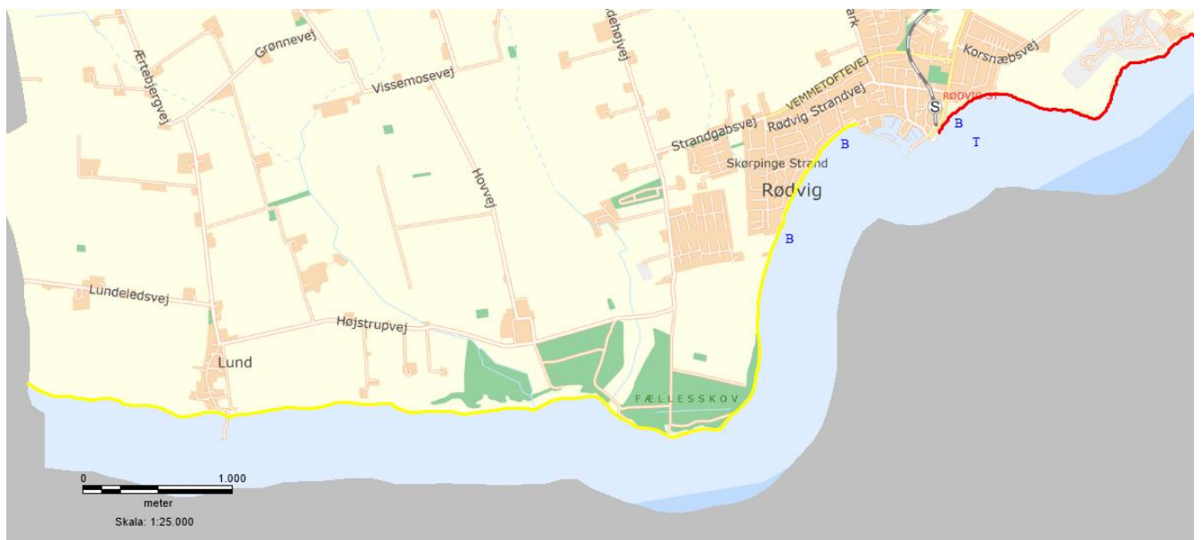
Zoneinddeling for Lund og Rødvig.